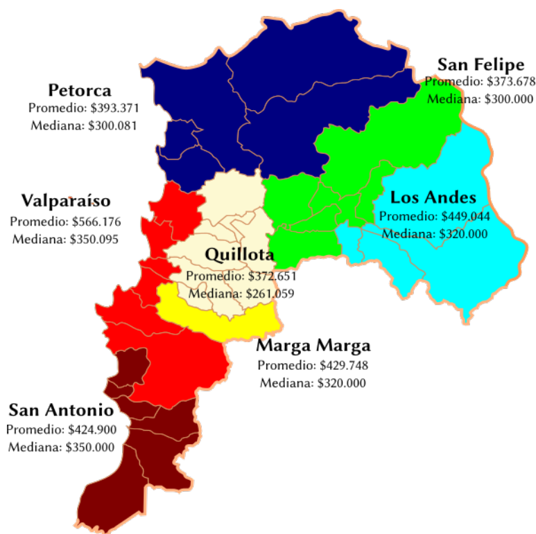
Gráfico 1: Promedios y Medianas de ingresos de la ocupación principal según provincias de la V Región de Valparaíso

En cuanto a la distribución salarial por provincia, se puede concluir que mientras el 50% de los trabajadores de Valparaíso y San Antonio gana menos de $350.000, en Petorca y San Felipe la mediana es $300.000. Por su parte, Quillota exhibe una mediana de $261.059. En las provincias restantes, Los Andes y Marga Marga, la mediana es $320.000. El mayor nivel de atraso salarial en la región de Valparaíso, se observa en las provincias de Petorca, Quillota y San Felipe, donde el 70% de los trabajadores gana menos de $400.000 líquidos.